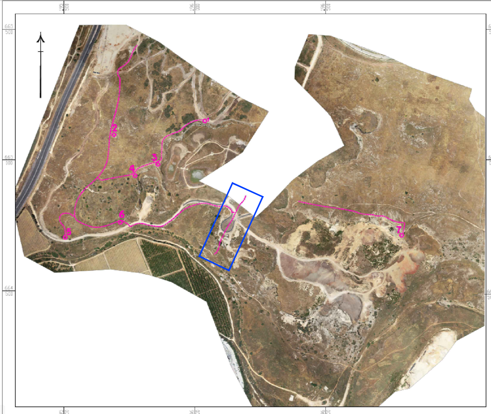
מראה מקום - ללא קני"ח

המומין: הקרן לשיקום מחצבות מקום: גן לאומי ראש העין פרויקט: שבילים ומצפורים המבצע אחראי לבידוק התכנית והאמתן במקום. על המבצע לבקר את כל המידות ולהודיע למתכנן לפי הביצוע על כל טעות או אי-התאמה. אין לקבוע מידות ע"י מדידה בשטח. אין לעשות כל שימוש בתכנית זו או ברישום הגולמים בה ללא אישור בכתב מהמתכנן. תכנון: אסף קשטון תחום: אדריכלות שריטוט: מרב בן נון תאריך מקור: 11.9.22 ביקורת: מס' עבודה: 16-032 קובץ: l:\archi\16-032.MG_TZE\PROJECT\3-לב\lwg\work\2022\plan-1-3.22.dwg