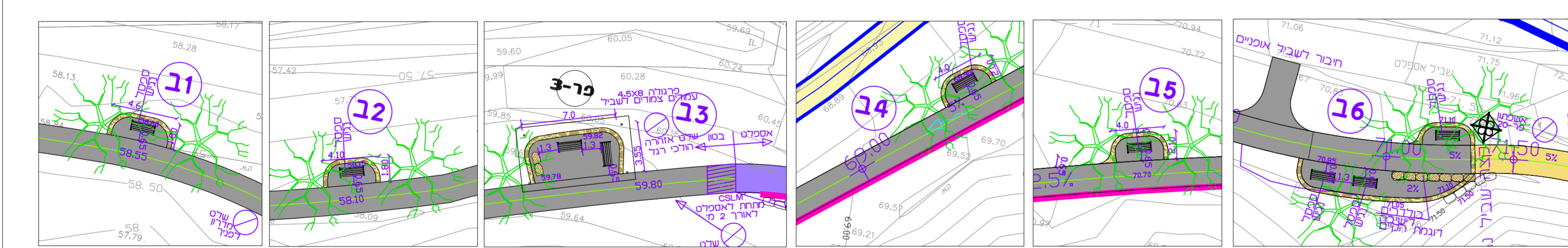
רחבות מנוחה 1:250