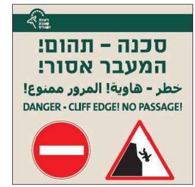
סכנה תהום! המעבר אסור!